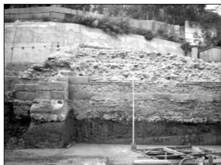
фиг. 6 Кавеата и орхестрата на театъра - поглед от север