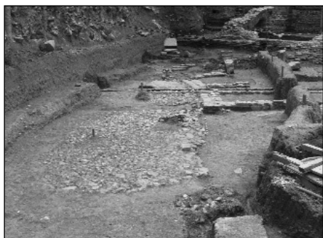
фиг. 3 Римски театър - поглед от юг