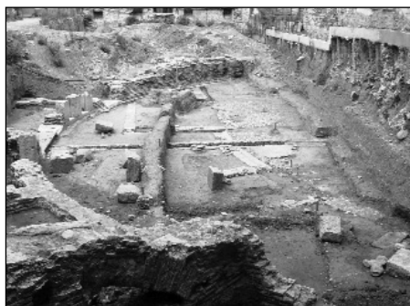
фиг. 4 Кавеата и орхестрата на театъра - поглед от север