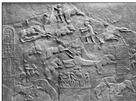
фиг. 1 Релефна плоча - афиш