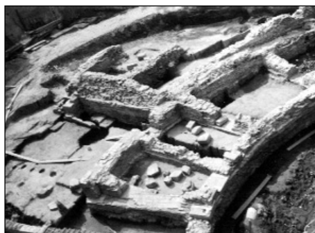
фиг. 5 Римски театър - поглед от юг