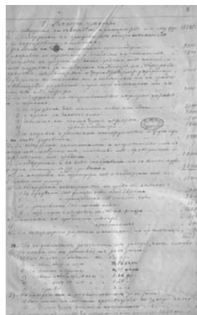
Фиг. 1 Първо заседание на градския управителен съвет от 13 февруари 1878 г. Фиг. 2 и 3 Първият приет бюджет на Софийска градска община от 11 януари 1879 г.